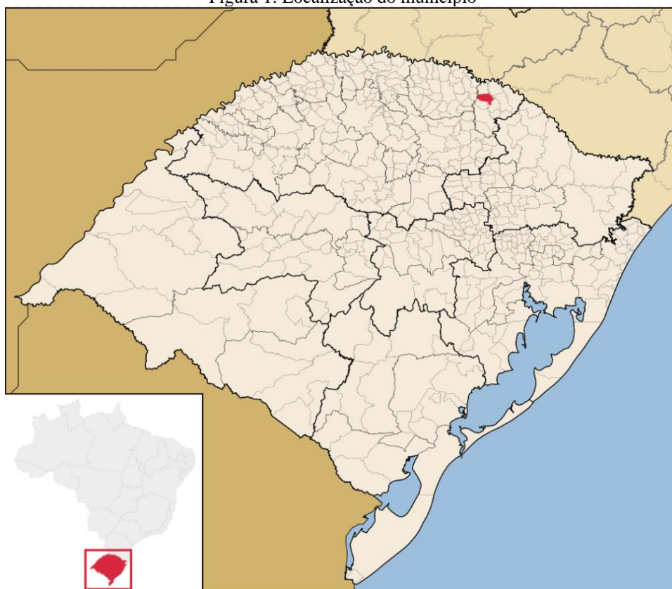
Figura 1: Localização do município

Paim Filho é uma cidade de Estado do Rio Grande do Sul. O município se estende por 182 km 2 e contava com 3.629 habitantes no último censo. A densidade demográfica é de 21,6 habitantes por km 2 no território do município. Faz divisa com os municípios de Maximiliano de Almeida, Cacique Doble e São João da Urtiga. Situando-se numa altitude média de 576 metros.