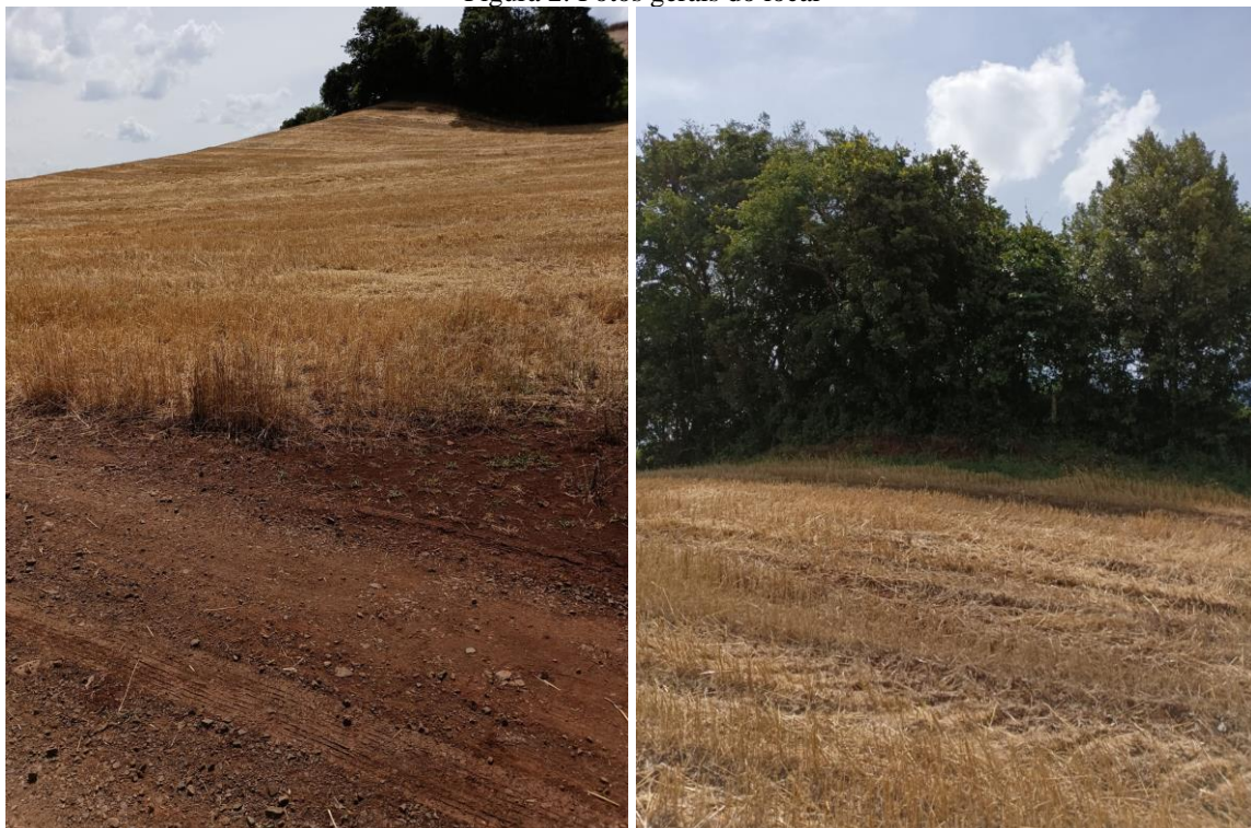
Figura 2: Fotos gerais do local

Abaixo são apresentadas fotos gerais do local de interesse.